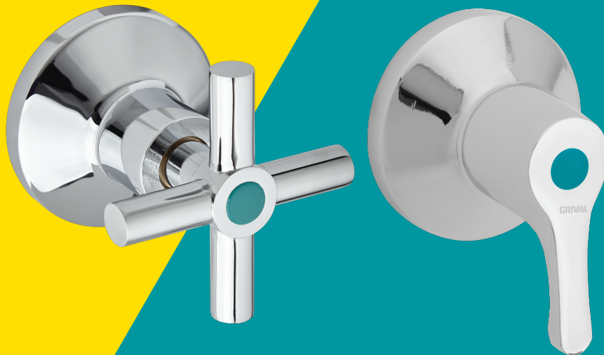
PASO DE BOLA CRUCETA